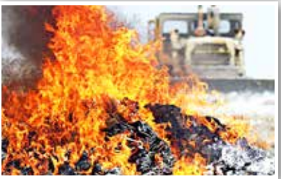
عکس ها: حسن رضیعی مشهد آن