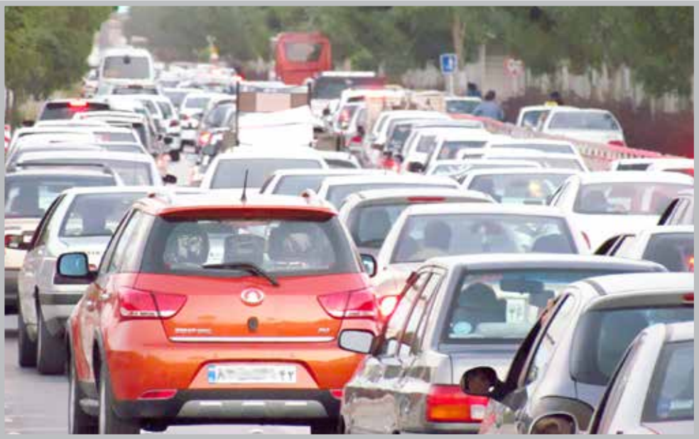
عکس ترافیکی است

پنجمینشنبه ۲۹ مهر ۱۳۹۵ | ۱۸ محرم ۱۴۳۸ | ۲۰ اکتبر ۲۰۱۶ | سال بیست و نهم | شماره ۸۲۴۳ | ویژه نامه ۲۶۳۷ |