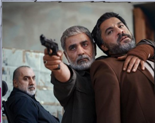
مهر به خیر سینه های ما!!