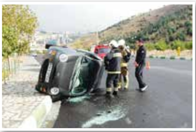
کسب نجات زخمی

بیرجند-خبرنگار قدس: فرمانده انتظامی شهرستان قاین از واژگونی یک خودرو ام وی ام و کشته شدن سرنشین آن خبر داد.