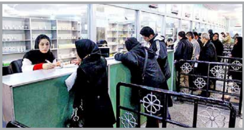
مشکل تهیه داروهای خاص با تعطیلی داروخانه هلال احمر در ایرانشهر

ایرانشهر / حسین سپاهی: مردم جنوب استان سیستان و بلوچستان (ایرانشهر) از مسؤولان ذی ربط خواهان رفع نیازهای این منطقه در خصوص داروهای کمیاب شدند. دیده ور، یکی از شهروندان ایرانشهر گفت: باید فاصله ۴۰۰ کیلومتری ایرانشهر تا زاهدان را با هزینه‌های هنگفت طی کنیم تا شاید موفق به گرفتن یک دارو شویم.