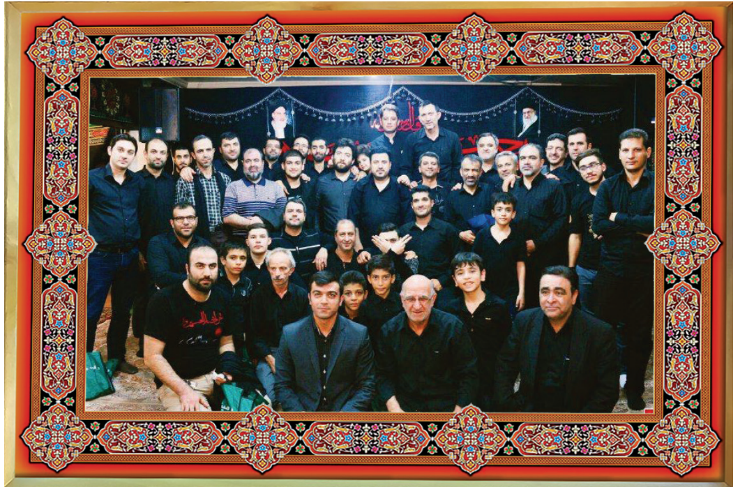
[ عکس یادگاری: هیأت محبان المهدی (ع) نازی آباد، سال ۱۳۹۵ ]

اگر مشکلات اقتصادی دارید و همه راه‌ها برایتان بسته شده، هیچ‌وقت فکر گرفتن ربا به ذهن‌تان خطور نکنند. اصلاً دور آن را خط قرمز بکشید و چند راه حل دیگر را امتحان کنید. عقده‌های اسلامی بهترین راه برای معامله است که اسلام شکل صحیح آنها را گفته که هم حالند و هم سود دارند. قرض اولین راه است. هنوز هم آدم‌ها یا مؤسسه‌هایی هستند که کارشان دادن وام قرض‌الحسنه است. مثل صندوق مساجد و مؤسسه‌هایی که برای دادن وام تأسیس شده‌اند. مضاربه دومین راه است. مضاربه عقدی است که با آن یکی از طرفین معامله به عنوان مالک، سرمایه‌ای نقدی را جور می‌کند و طرف دیگر معامله با آن تجارت می‌کند و در سود و زیانی که به دست می‌آید هر دو طرف شریک می‌شوند. مشارکت مدنی راه بعدی است. این نوع مشارکت یعنی قاطعی کردن میزان سرمایه‌ای که هر شریک می‌آورد. این کار برای راه انداختن کار یا سرمایه‌گذاری است و در آن تقسیم سود بین طرفین به نسبت سرمایه‌ای است که آورده‌اند. جعاله هم راه حل خوبی است. جعاله یعنی جاعل (کارفرما) مبلغ مشخص و تعیین شده‌ای را در ازای انجام کار مشخصی به کسی که آن را انجام داده بدهد. آخرین راه حل پیشنهادی ما راه‌اندازی صندوق‌های خانوادگی است. یک صندوق قرض‌الحسنه خانوادگی یا دوستانه یا با مشارکت همکارانتان می‌تواند شما را از ربا دور کند. فقط کافی است ماهانه مبلغ مشخصی را روی هم بگذارید و یک نفر برنده شود و این روال را تا تمام شدن قسط‌های همه ادامه دهید.