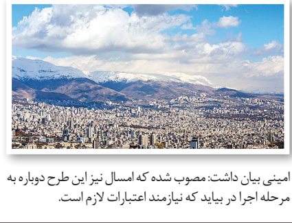
امینی بیان داشت: مصوب شده که امسال نیز این طرح دوباره به مرحله اجرا در بیاید که نیازمند اعتبارات لازم است.