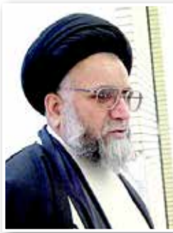
نیشابور - خبرنگارقدس:

حوزه و دانشگاه هر دو با روح و جان انسان سر و کار دارند و تأثیرات زیادی بر جامعه دارند و عده‌ای به دنبال دین سنتی کردن دانشگاه و علم سنتی کردن حوزه هستند.