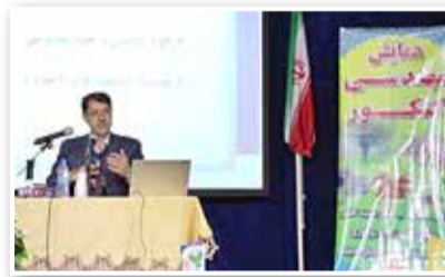
گناباد - خبرنگارقدس:

معاون آموزش متوسطه اداره کل آموزش و پرورش خراسان رضوی گفت: ۶۱ درصد دانش آموزان مقطع متوسطه در شاخه نظری تحصیل می‌کنند و تعداد دانش آموزان ورودی رشته تجربی با افزایش ۰۱۷ درصدی نسبت به سال گذشته به ۴۷/۵ درصد رسیده است که این نسبت باید کاهش یابد.