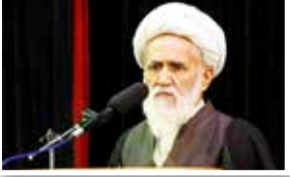
قم نیوز/ آیت‌الله حائری شیرازی استاد

حوزه: اسلامی که منهای اهل بیت(علیهم السلام) تفسیر می‌شود، از خدا دور می‌شود و به کفر می‌رسد، زیرا معلم قرآن را از آن گرفتند؛ وقتی غیبر از اسلام گرفته شد، اسلام به این روز افتاد.خداوند انسان‌شناسی را به عهد می‌گیرد، ولی علم الانسیا را به عهده انسان قرار می‌دهد؛ انبیا همان‌ها حل پرسش‌های عالم به سوی ما نیامدند؛ زیرا اگر همه سوالات را پاسخ می‌دادند، انسان‌ها در بی‌کاری غوطه ور می‌شدند، ولی آنها برای علم انسان آمدند تا انسان را بسازند. انسان‌شناسی در واقع بر عهده انسان نیست؛ همچون خلق گندم و جو و اشیای دیگر؛ انبیا به دنبال تعریف و تبیین انسان بودند؛ هر آیه قرآن، دارای پیامی در انسان‌شناسی است و هنر قرآنیان این است که این پیام را از هر آیه بگیرند.اهمیت عاشورا به این دلیل است که یک انسان‌شناسی جامع در آن انجام شده و انسان عقل و انسان جهل در مقابل هم قرار گرفتند؛ به همین خاطر است که کل زیارت عاشورا را می‌توان روی لعن و سلام استوار کرد؛ لعن یعنی احتراز از جهل انسانی و سلام نیز توجه به عقل انسانی است.