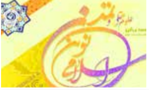
همایش علوم عقلی و تمدن نوین اسلامی در مشهد