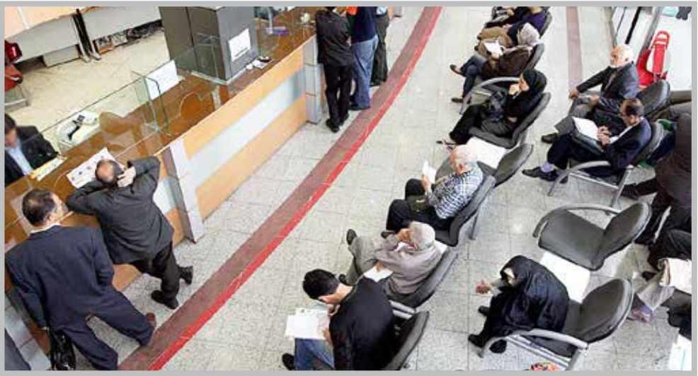
عکس تزیینی است

درگاهی تصریح کرد: برای این منظور توافق اولیه حاصل شده و در کنار آن، ورود عالی نظام به حل این مسأله نیز یک اتفاق خوب به شمار می‌آید که با رویکرد امتیاز دادن صورت گرفته است. سازمان بورس