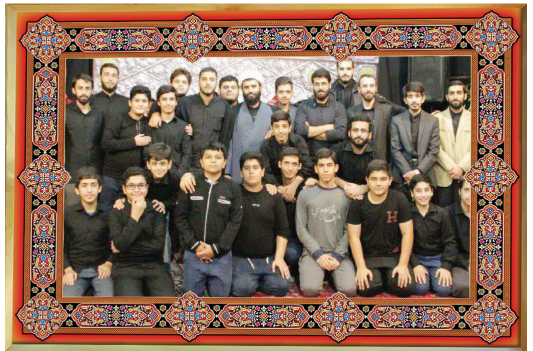
[ عکس یادگاری: هیأت میناق با شهدای گیلان، شب دوازدهم محرم ۱۴۳۸ ]

بچه‌هایتی‌ها باید چه ویژگی‌هایی داشته باشند و منش و اخلاق آنها باید چگونه باشد تا الگویی برای همه باشند؟ مسلم است افرادی که به هیأت‌ها می‌روند، صرفاً حضور آنها کفایت نمی‌کند بلکه باید کارهایی را انجام دهند و کارهایی را انجام ندهند تا زحمات و عزاداری آنها مثمرتر باشد. مهم‌تر از همه اینکه چنین افرادی بیشتر زیر ذره‌بین هستند و اگر خدای نکرده کار اشتباهی بکنند بعضی‌ها رفتارشان را به حساب هیأت می‌گذارند. برای همین خیلی باید مراقب باشند و طوری رفتار کنند که دیگران از آنها کارهای خوب را یاد بگیرند. ویژگی‌های اولیه یک بچه‌هایتی اینهاست: برای خواندن نماز اول وقت و دعا، دغدغه و برنامه روزانه دارد، صادق است و دروغ نمی‌گوید. به قول معروف نمی‌پوچاند، امانتدار است و مراعات حق الناس را می‌کند، تواضع و افتادگی دارد، اهل گریه (بکاء) است. بکاء بر نفس به خاطر گناهانش و بر سیدالشهدا (علیه السلام) به خاطر مصایبی که به ایشان رسیده. بی‌انصاف بودن، طعنه زدن، لجاجت کردن، کینه‌ای بودن، آزار زبانی و عملی و تسویه حساب شخصی از دیگر خصوصیات مذمومی است که شایسته نیست در افرادی که در مجالس ائمه (علیهم السلام) شرکت می‌کنند دیده شود. بچه‌هایتی اهل ایثار و گذشت است و از حق خودش می‌گذرد اما از حق دیگران نمی‌گذرد. نه تنها بار خودش را بر دوش دیگران نمی‌اندازد بلکه بار دیگران را برمی‌دارد. اهل از زیر کار در رفتن نیست و در یک جمله اخلاق و رفتارشان الگو و نمونه است.