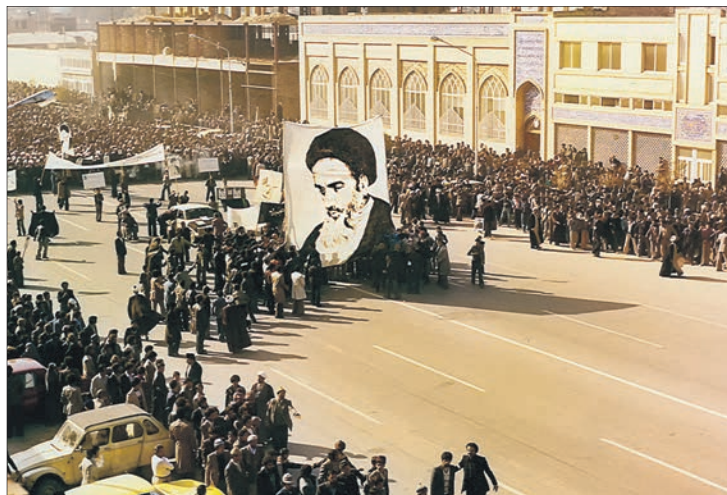
تصویری از امام خمینی(ره) که توسط علی رضا خالقی نقاشی شده پیشاپیش راهپیمایی‌های انقلابی در مشهد بوده است

بنده پس از پیروزی انقلاب با آستان قدس همکاری داشته‌ام، لذا به علت عدم حضور قبل از انقلاب نمی‌توانم ارزیابی دقیق داشته باشم. بدیهی است با پیروزی انقلاب اسلامی و تعیین تولید از سوی رهبری نظام، خط مشی هنر و بطور کلی برنامه‌های آستان قدس تغییر اساسی پیدا نموده است و آنچه امروزه به عنوان هنر اسلامی و مردمی می‌نامیم در آستان قدس رضوی نمود پیدا کرده است؛ البته بنده به لحاظ سه دهه حضور در آستان قدس معتقدم با تمام تلاش‌هایی که صورت پذیرفته، هنوز راه زیادی با هنر اصیل اسلامی و مردمی داریم و آستان قدس به عنوان یک سازمان وسیع و امکانات فراوان می‌تواند بهتر و بیشتر از آنچه هست انجام دهد.