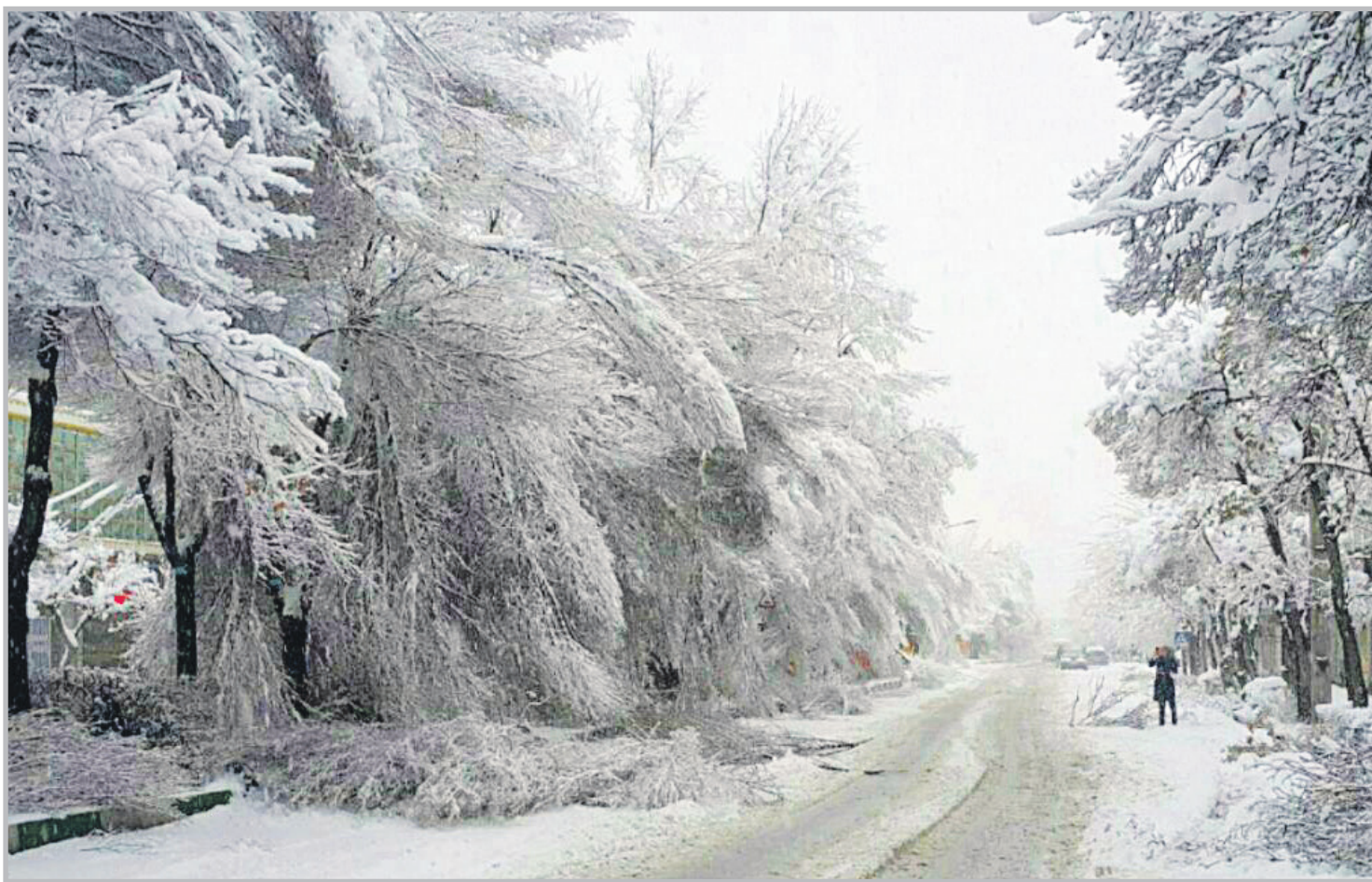
تلفات از برف سنگین در اراک