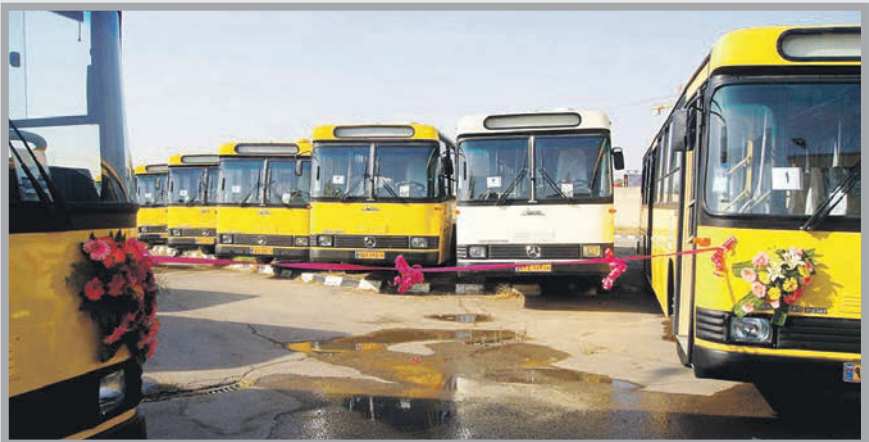
عکس تزئینی است

۱۱۲ دستگاه اتوبوس با روش «برد برد» در مشهد آغاز به کار خواهند کرد