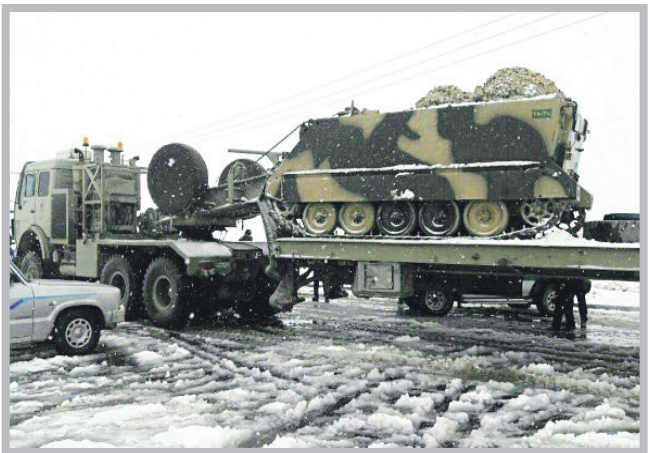
اعزام نفر بر ارتش برای امداد رسانی به گرفتاران در سیل و برف