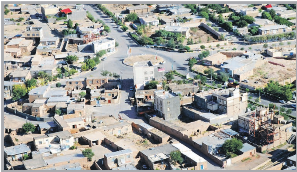
عکس تزئینی است / مکتومنها، فرامرز عاقل بریدار / قدس

منتظر سوززه‌های شما از طریق سامانه پیامکی هستیم. شماره پیامک: ۰۰۰۰۷۲۳۰۵