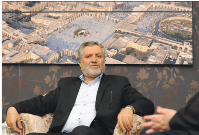
باید سهم و مقدار در دستگاه نسبت به تعقل در وظایف احصا و سپس مورد قضاوت قرار بگیرد.

وی با اشاره به احداث کمربند سبز، می‌افزاید: به غیر فضای سبز شهری تاکنون ۵ تا ۶ هزار هکتار زمین نیز برای کمربند سبز تملک شده که بخشی از این اراضی زیر غرس نهال رفته است. وی توجه به توسعه زیرساخت‌ها در همه