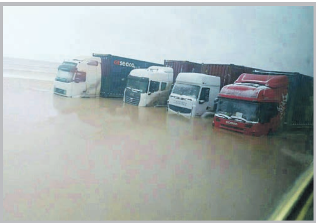
سیل در گلبرگ دوقلوران