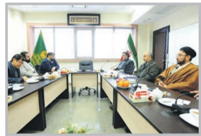
مدیر کل بنیاد شهید در دیدار با مدیر مسؤول روزنامه قدس خبر داد

قدس چندین گزارش با هدف رفع محرومیت از این شهرک مانند «اینجا آخر نیست» و «گره هزار توی بی مهری های مهرگان باز می شود»، به چاپ رسید که از جمله همین دیروز نیز تیرتیر نخست روزنامه به مطالبه رهبر معظم انقلاب با عنوان «رسیدگی با ...» صفحه ۴