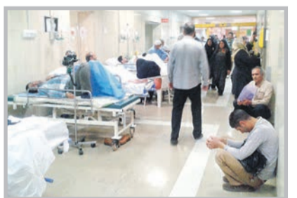
مسؤولان سازمان نظام پزشکی خراسان رضوی انتقاد کردند

قدس: حتماً خبر گور خوابها را شنیده اید و اما بعد از این خبر پیدا شدن فردی که در یک حفره زندگی می کند به نقل از رئیس بهزیستی قوچان دیروز در صدر اخبار فضای مجازی قوچان قرار گرفت. رئیس بهزیستی قوچان در... صفحه ۲