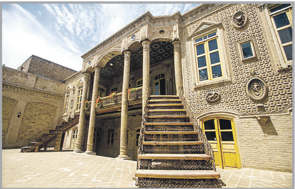
عکس تزیینی است

هنگامه طاهری ♦ این روزهایی که مشهد ۲۰۱۷ را شاهدیم، از موضوعات فراموش شده‌ای که امروز مسؤولان سعی دارند گرد آن را بکنانند «مشهد قدیم» است. در این راستا چندی پیش شاهد برگزاری نمایشگاه «مشهد دوست داشتنتی» بودیم؛ در این نمایشگاه مدلی از بازارها و مردمی با لباس‌های سنتی به نمایش در آمد.