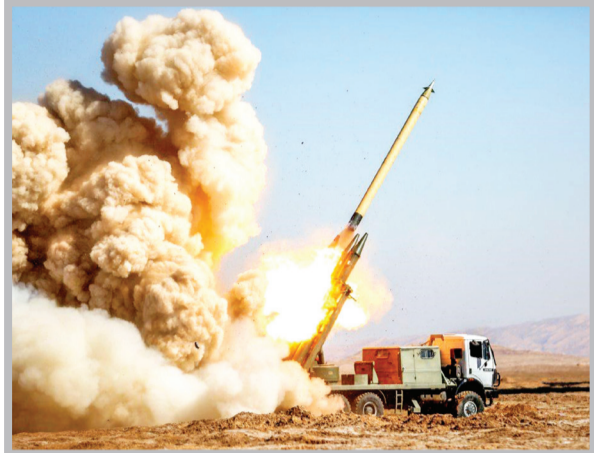
نمایش بخشی از توان دفاعی ایران در رزمایش‌ها بیانگر عزم جدی مقامات کشورمان برای تامین امنیت مردم بدون تأثیر از تهدیدها و معادلات غرب است

سیاست / مسعود بصیری | برگزاری رزمایش‌های جمهوری اسلامی ایران طی ماه‌های گذشته نشان داده است اقتدار کشور ما در حوزه دفاعی ارتباطی با تهدیدها و خط و نشان کشیدن‌های غرب و به خصوص آمریکا ندارد. ایران در سال‌های اخیر ضمن تقویت و به روز رسانی قدرت دفاعی خود، آن را از تمام زوایا بندهای سیاسی دور کرده و به خصوص اجازه ندهد است سابه برخی رفتارهای دیپلماتیک روی افزایش ظرفیت دفاعی کشور اثرگذار. خوشبختانه این اجماع نیز در کشور بین قریب به اتفاق مسئولان با گرایش‌های مختلف وجود دارد که نباید ظرفیت دفاعی و امنیتی کشور کاهش یافته یا تحت تأثیر حاشیه‌سازی‌های دشمنان قرار گیرد. در این خصوص هم سپاه و هم ارتش ضمن توجه ویژه به افزایش تکنولوژی‌های دفاعی کوشیده‌اند با برگزاری رزمایش‌های قدرتمند و موفق این پیام را به مردم کشورمان و همچنین برخی دولت‌های آمریکا دوست منطقه یادآور شوند که امنیت ایران قابل معامله نیست. رزمایش اخیر سپاه پاسداران انقلاب اسلامی هم در همین راستا برگزار شد و در واقع تأکیدی بود بر این که هیچ کس نمی‌تواند بدون احترام و با زبانی تهدید با ما صحبت کند. از سوی دیگر ساخت و آزمایش پیشرفته‌ترین سلاح‌های دفاعی این پیام را هم برای مسئولان کشورمان داشت که می‌توان با همت و دانش ایرانی به آنچه دست نیافتنی می‌نماید دست پیدا کرد.