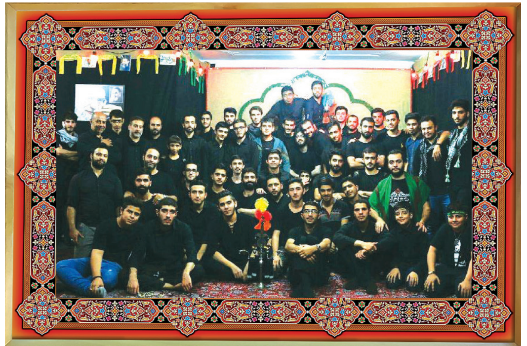
[ هیأت مکتب‌المهدی، تهران، نازی آباد ]