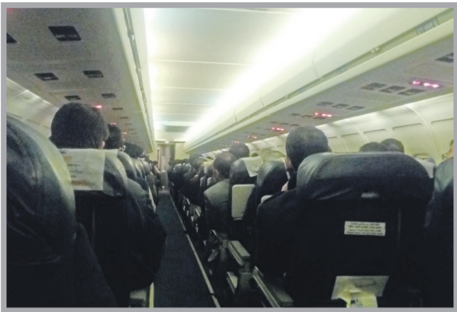
کسب تفریحی است- ویدئو اکبری

وی با اشاره به اینکه مسافران چهار ساعت و ۳۰ دقیقه در پرواز آتا و چهار ساعت در پرواز هواپیمایی معراج توقیف بودند، اضافه کرد: این مسأله مشکلاتی را برای مسافران ایجاد کرد بویژه اینکه در پرواز مربوط به