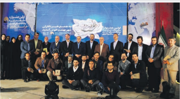
عکس: فراتر از عاقل، پروردگار / قدس