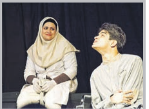
..... صفحه ۲