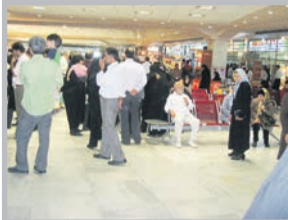
..... صفحه ۴