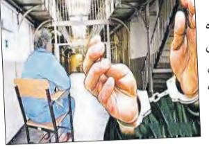
خط قرمز: رسیدگی به پرونده پیرمرد سمساری که دختری خردسال را ربوده و در خانه‌اش مخفی کرده بود، در دادگاه کیفری استان تهران به صورت غیرعلنی برگزار شد.

چندین پیش زنی در تماس با مأموران انتظامی در یکی از شهرستان‌های حاشیه تهران از ناپدید شدن ناگهانی دختر پنج ساله‌اش خبر داد. او به مأموران گفت: ظهر امروز دختر خردسالم برای بازی به کوچه رفت. از او خواستم مقابل در بازی کند، اما چند دقیقه که گذشت، دیگر صدایش را از کوچه نشنیدم. به داخل کوچه رفتم و اثری از دختر کوچک ندیدم که به همین دلیل نگران شدم و سریعاً با پلیس تماس گرفتم. مأموران جست‌وجوهای خود را آغاز کردند در حالیکه هیچ اثری از دختر خردسال شاکي نبود و بالاخره سرخ حل این پرونده را یکی از کسبه در اختیار مأموران انتظامی قرار داد. او به مأموران گفت: مردی مسن در این محله زندگی می‌کند که یک وانت دارد. او تنها زندگی می‌کند و روزها در کوچه‌ها می‌گردد و اسباب و وسایل جابه‌جا می‌کند. معمولاً زیاد او را در این دور و بر می‌بینم. او را دیدم در حالیکه دست بچه را گرفته بود. با به دست آمدن این سرخ، متهم دستگیر و دختر خردسال نیز در خانه او کشف شد. متهم پس از انتقال به کلانتری مورد بازجویی قرار گرفت و گفت: من دختر بچه خردسال را در کوچه دیدم. لباس هایش نامرتب بود، برای همین او را به خانه‌ام بردم تا لباس هایش را تعویض کنم. من هیچ جرمی مرتکب نشده‌ام.