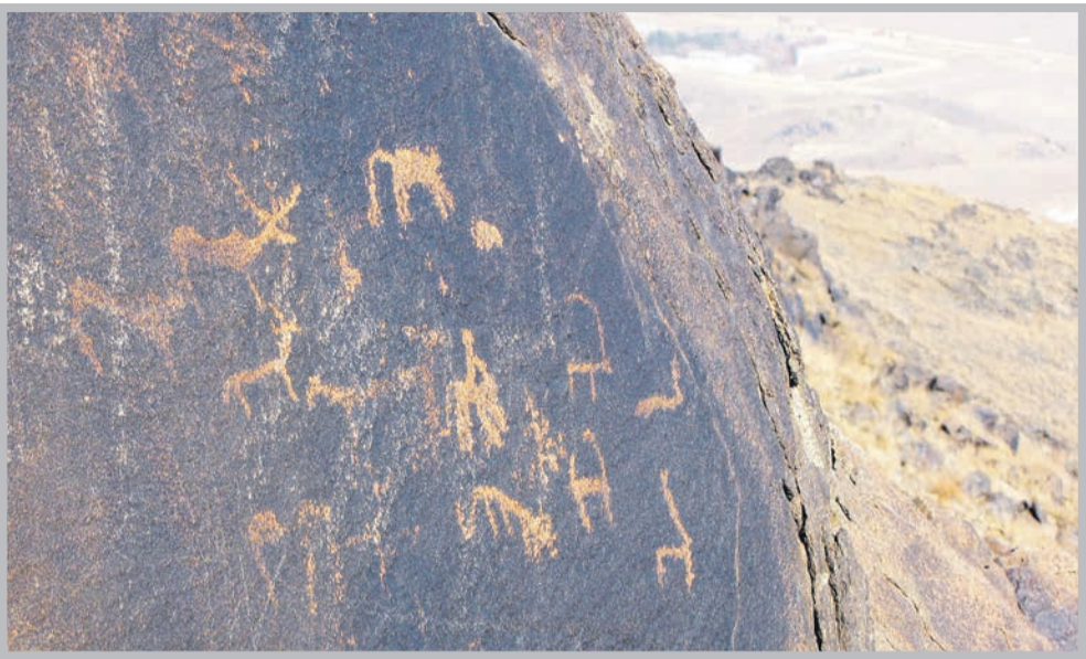
عکس: حسن احمدی فرد