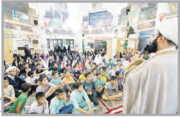
عکس: ایت‌الله العظمی آیت‌الله مکارم شیرازی

آستان/ سارا صالحی احمشهری بهشت هستند؛ گاهی دور و گاهی نزدیک، همه دلدادگان زیر سایه رحمت و کرامت حضرتش مساوی می‌گیرند. چه آنان که همسایه نزدیک حضرت رضاع) هستند، چه آن‌ها که جایی دورتر، دل در گروی مهرش سپرده‌اند.