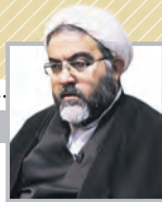
فلسفه‌ستیزی و فلسفه‌پرستی هر دو خواست سنجانی، در نشست «توسعه و تکامل فلسفه: افق‌ها و راهکارها» گفت: اگر قرار است در عصر جمهوری اسلامی تحولی در دانش فلسفه است و اگر فلسفه ما دگرگون نشود، نباید انتظار داشته باشیم که ما در حوزه فقه و اصول و دانش‌های انسانی (جامعه‌شناسی، روان‌شناسی و اقتصاد) بتوانیم کاری اساسی انجام دهیم.