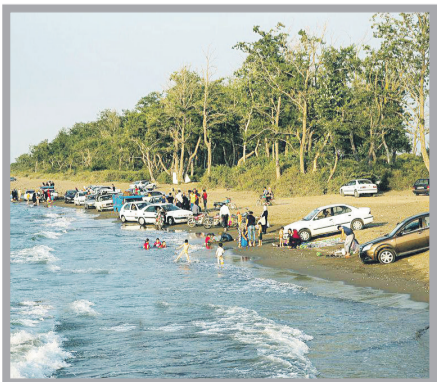
ما خیزی‌ها، مردمان قناعت‌پیش‌های هستیم و تنها دلمان می‌خواهد با این گلستانه چشم‌نواز - چون آب و خاک خود - رفتار کنیم... کمی عقلا، کمی عاشقانه...