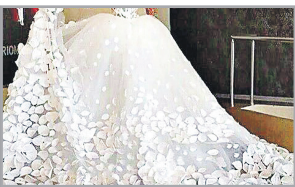
عکس ترنلینی است

این در حالی است که با یک حساب سرانگشتی خیلی سریع می‌توان دخل و خرج این مزون‌ها را محاسبه کرد چراکه عمده هزینه راه اندازی این مزون‌ها مربوط به اجاره یا رهن مکان مورد نظر است.