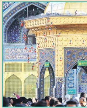
امام رضا (علیه السلام) می‌فرمایند:

وی در خصوص دیگر آیت‌های این برنامه به گزارشات مردمی از زائران و مجاوران اشاره کرد و گفت: این برنامه از هفتمین روز دهه کرامت آغاز و تا شامگاه میلاد حضرت رضاع (ع) ادامه خواهد داشت.