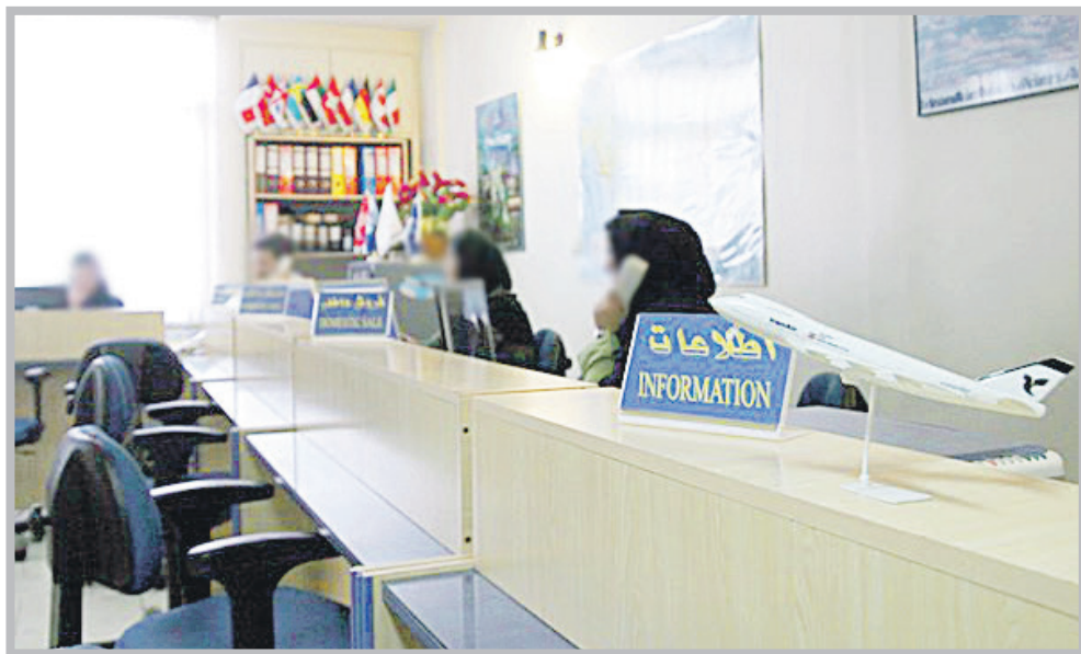
عکس تزیینی است