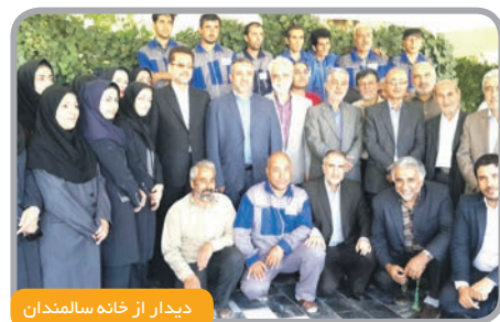
دیدار از خانه سالمندان