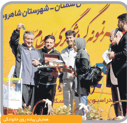
همایش پیاده روی خانوادگی