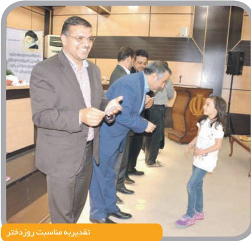
تقدیر به مناسبت روز دختر