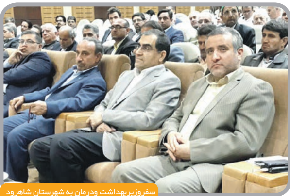
سفر وزیر بهداشت و درمان به شهرستان شاهرود