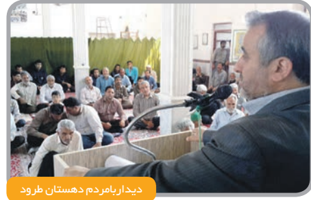
دیدار با مردم دهستان طرود