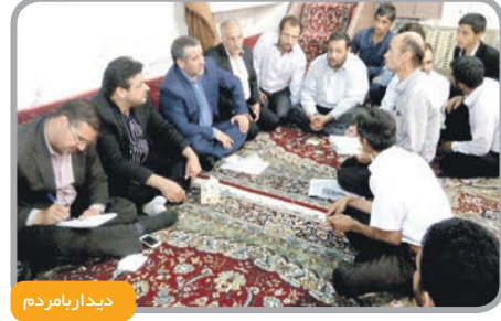
دیدار با مردم