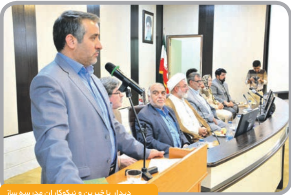
دیدار با خیرین و نیکوکاران مدرسه ساز

عنوان کرده اند، پیش از آنکه مردم به ما مراجعه کنند ما و مسئولین باید در بین آنها حضور پیدا کنیم و به درد دلشان گوش بدهیم و همیشه تاکید می کنند که وظیفه ما افزایش نشاط، امید، معیشت و رفاه مردم است، ما رسالتی جز خدمت صادقانه و بی منت به این مردم شریف در دولت تدبیر و امید نداریم.