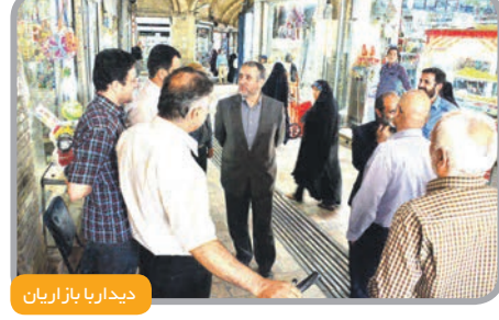
دیدار با بازاریان