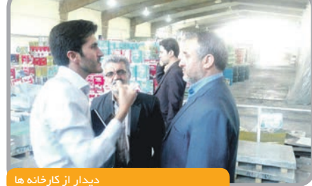
دیدار از کارخانه ها