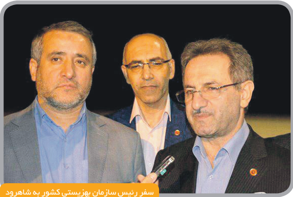
سفر رئیس سازمان بهزیستی کشور به شاهرود