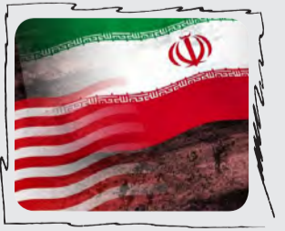
# فلانسون چه؟

زور گویی که فقط مخصوص رژیم صهیونیستی و نیروهای عجیب و غریب تکفیری ها نیست. آمریکایی ها هم با این همه ادعای دموکراسی حسابی زور گو هستند. به تازگی وزارت خارجه آمریکا اعلام کرده است اگر مسافران ایرانی می خواهند به این کشور سفر کنند، باید ۱۵ سال از زندگی گذشته خود را به همراه فعالیت هایشان در فضای مجازی به آمریکایی ها خیلی تشریحی و واضح نشان دهند.