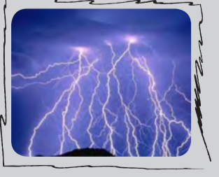
# یعنی هیچ کارشان نمی کشد کرد؟

همیشه آدم ها سر خودشان بلا نمی آورند بلکه بعضی وقت ها هم از زمین و آسمان سرشان بلانازل می شود. حالا حکایت هندی ها است که راستی راستی گرفتار شده اند. در هفته گذشته در دو روز ۳۴ نفر بر اثر برخورد آذر خشی در هند جان شان را از دست دادند. بیشتر این افراد بخت برگشته کارگران و کشاورزان بودند که در فصل بارندگی در حال کار روی مزارع کشاورزی بودند. معمولاً در فصل باران های موسمی که از ژوئن تا سپتامبر در هند برقرار است، بر اثر توفان، بارندگی و سیل، مردم و زمین های کشاورزی حسابی بلا سرشان می آید و خسارت می بینند و داغان می شوند. شاید باورتان نشود، اما بیش از ۲۵۰۰ نفر در سال ۲۰۱۴ بر اثر برخورد صاعقه در ایالت های هند کشته شده اند.