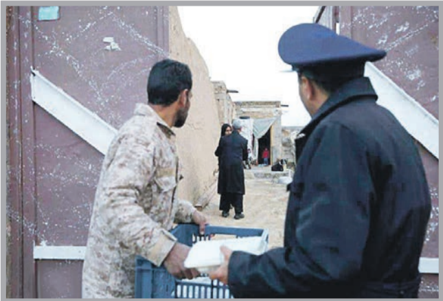
کوشه‌ای از خدمات آستان قدس رضوی به طایفه شهبان و زاده زندگان