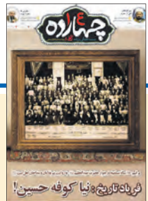
در این شماره ویژه نامه «چهارده» می خوانید: فریاد تاریخ و نیا کوفه حسین!

سالروز شهادت یادگار حماسه نینوا، خورشید فقاقت و دانایی و شکافنده علوم، حضرت امام باقر علیه السلام را تسلیت و تعزیت می گویم