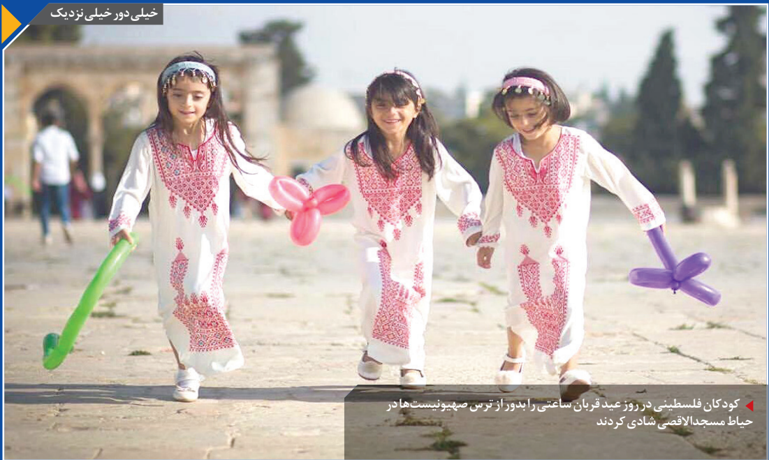
کودکان فلسطینی در روز عید قربان ساعتی را بدون از ترس صهیونیست‌ها در حیاط مسجد الاقصی شادی کردند