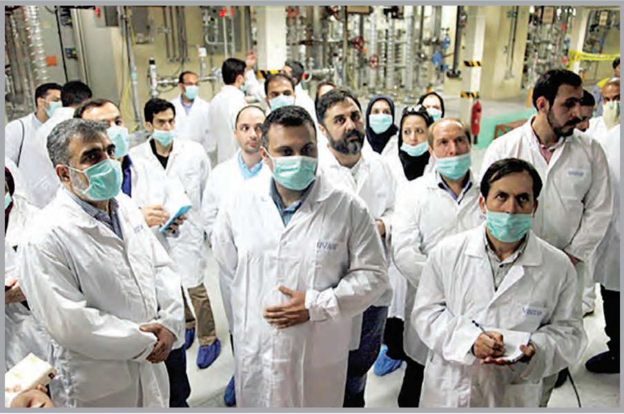
بازدید هیئت رسانه‌ای از تأسیسات غنی‌سازی شهید احمدی‌روش (نظنز)