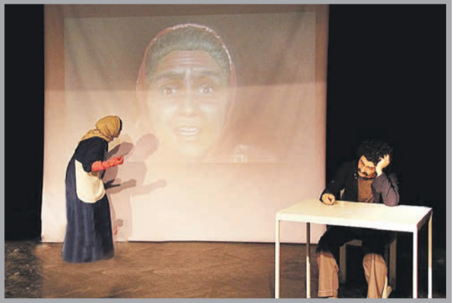
عکس ها، مشهد تئاتر

نسل جوان قرار گیرد. این هنرمند پیشکسوت با اشاره به اینکه دوره های آموزشی، مهتر می شود: بسیاری از بازیگران بودند که با وجود درخشش در جشنواره های مختلف تئاتر-، به دلیل عدم کسب علم بازیگری