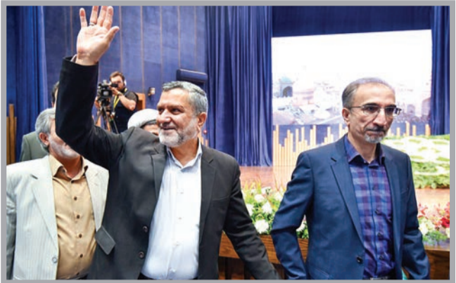
نگارنده: سعید شمس‌الادینی

بختیاری همچنین به خدمات گسترده آستان قدس رضوی از ابتدای پیروزی انقلاب اسلامی تا امروز اشاره کرد و اظهار داشت: با تأکید حجت‌الاسلام و المسلمین رئیسی، آستان قدس رضوی در کنار شهرداری مشهد و سایر