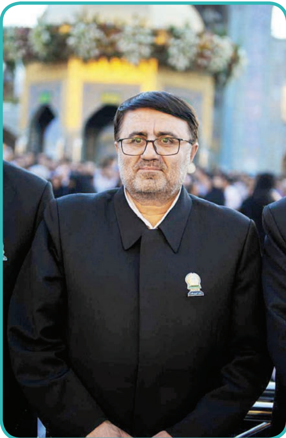
✽ عکس: حسین کام‌شاد / قدس

بله، در مورد ماجرای تربت جام و دستگیری آن فرد شرور در شب بیست و یکم