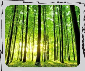
# جمع کن بزم شمال