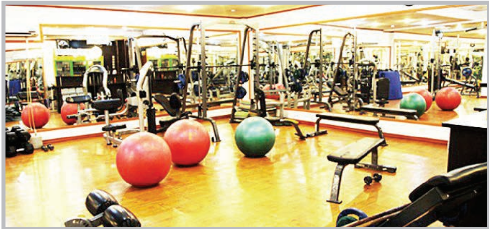
عکس تزیینی است

هنگامه طاهری ♦ می‌گفت پسر جوان آمده بود، باشگاه برای ورزش، اما نمی‌دانیم چرا داریم دچار حالت تهوع می‌شد و هر چه در شکمش بود، برمی‌گرداند.