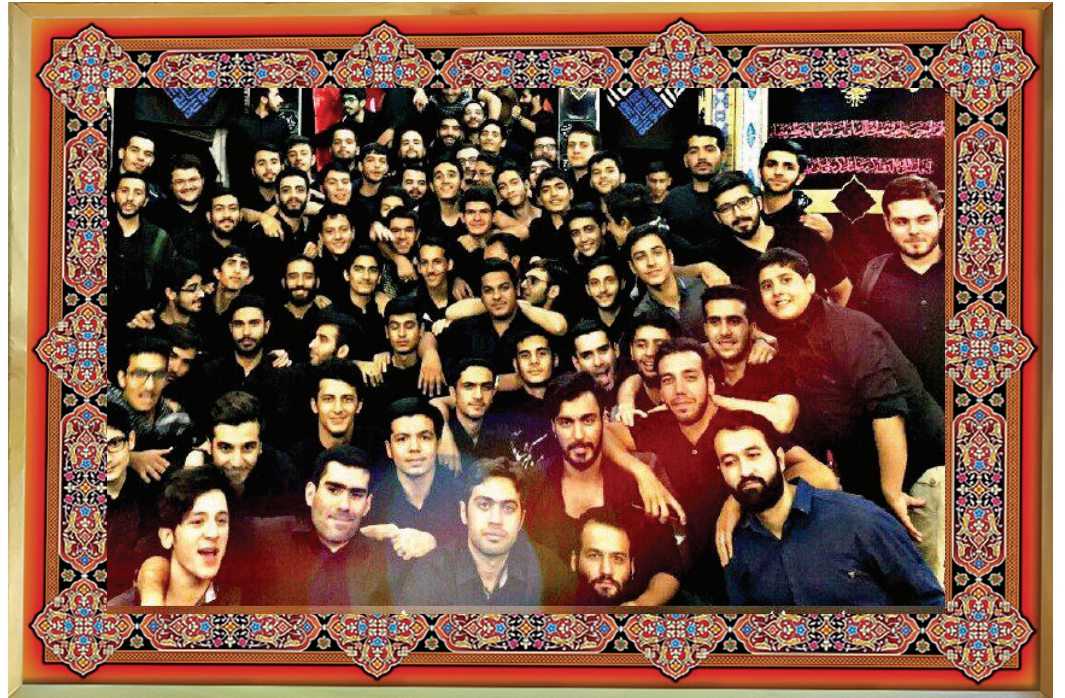
هیئت محبان المهدی واقع در خیابان کمیل