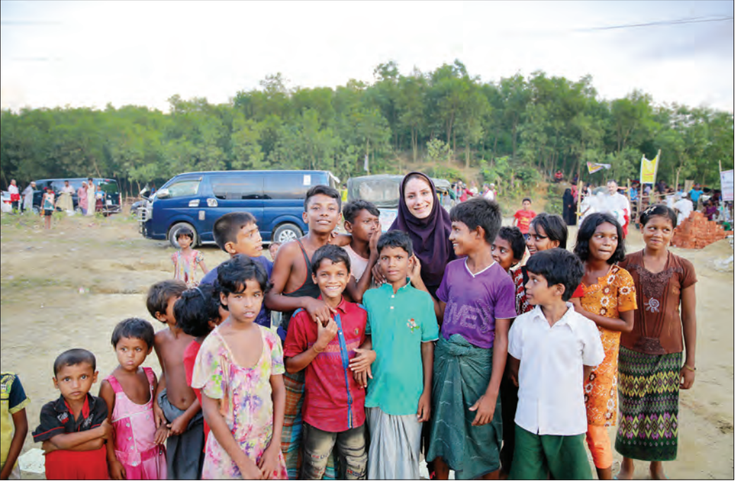
یک عزم جدی دارد.

ملل، یونسف یا فدراسیون بین‌المللی صلب سرخ در شرایط دشوار یافته منتشر کرده است. تصور از میاممار و وضعیت شرایط سختی آنجا حکم‌فرماست و با تمام تجارنی که قبل آن، از مردم کشور داشتم و درها و زخم‌ها را دیده بودم اما شرایط آنجا بسیار متفاوت، سخت‌تر و تلخ‌تر بود.»