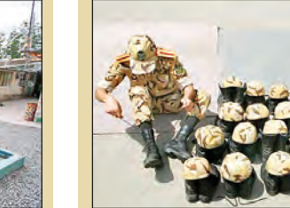
یک عزم جدی دارد.

آوارگان روهینگایی آینده‌ای مشخص نداشته و در محرومیت و مظلومیت مضاعفی به سر می‌برند. آیا فریادرسی وجود دارد؟