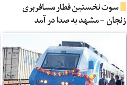
باشگاه خبرنگاران جوان: سوت نخستین قطار مسافربری پنج ستاره کشور در مسیر زنجان به مشهد و برعکس روز سه شنبه به صدا در آمد.