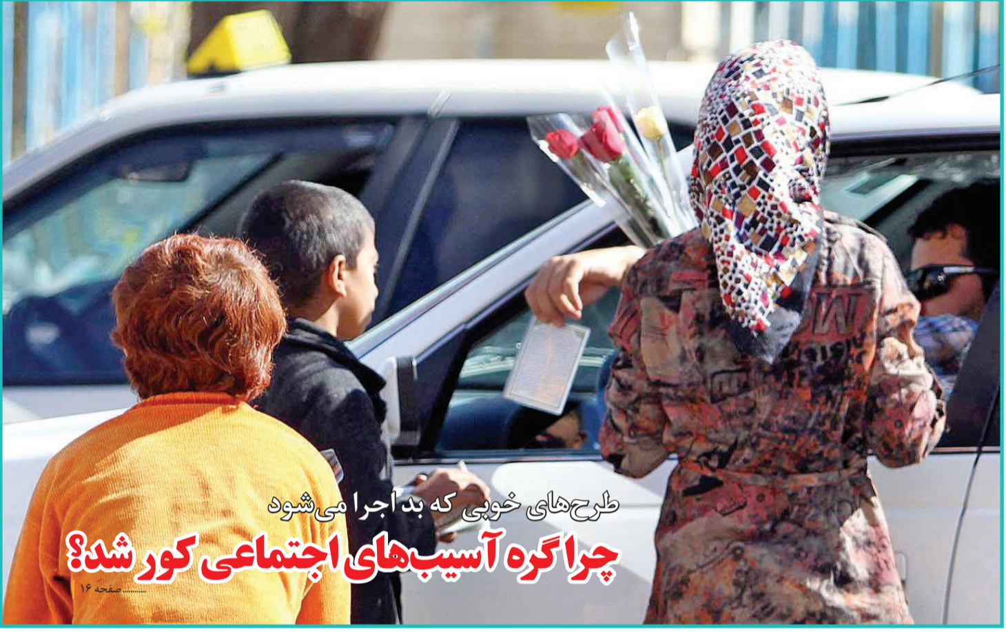
طرح‌های خوبی که بد اجرا می‌شود چرا گره آسیب‌های اجتماعی کور شد؟