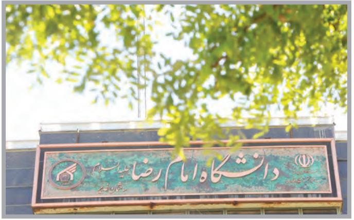
مجلس عالی قضایی / قدس

رئیس این دانشگاه در زمینه طرح ساخت دانشگاه(مجمع) جامع رضوی نیز گفت: مطابق برنامه‌ریزی‌های انجام شده در کمیسیون علمی و فناوری آستان قدس رضوی قرار است ساخت دانشگاه جامع رضوی در این نهاد مقدس به اجرا درآید و مراکز علمی، آموزشی، تحقیقاتی و دانشگاهی آستان قدس رضوی به صورت یک مجموعه گسترده به یک مکان واحد منتقل شوند. وی هدف از این طرح را هم‌افزایی بیشتر، افزایش بهره‌وری در زمینه‌های مختلف علمی و آموزشی، کاهش هزینه‌ها و... در زمینه فعالیت‌های دانشگاهی و علمی عنوان کرد.