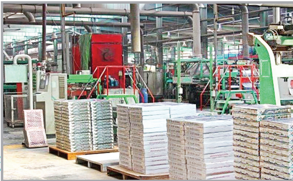
عکس تیرانی است