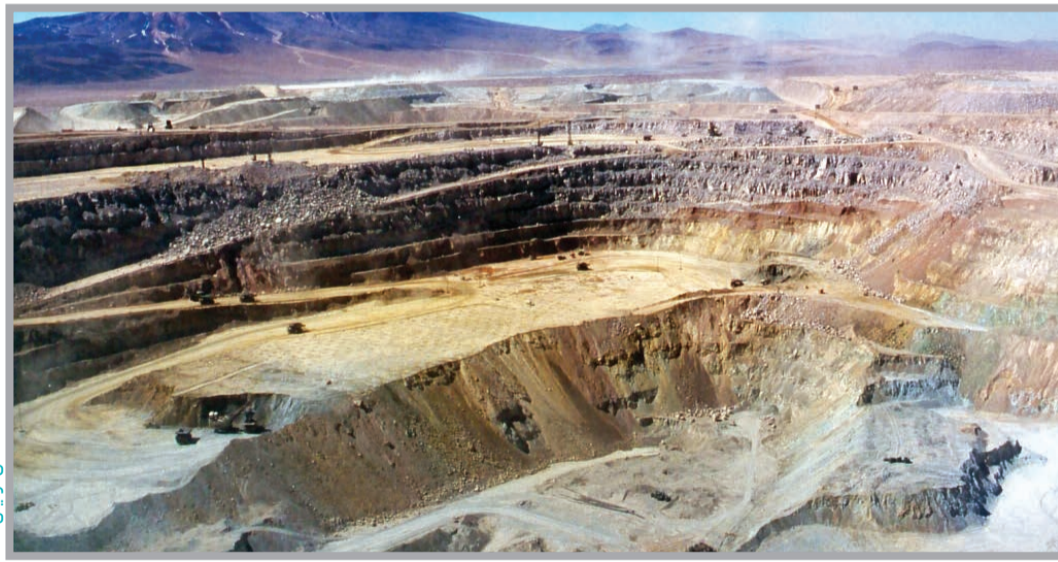
عکس تزیینی است

وی بیان می‌کند: اکنون ۱۷ معدن رودخانه‌ای در استان بوشهر فعال است که بیشتر در شهرستان