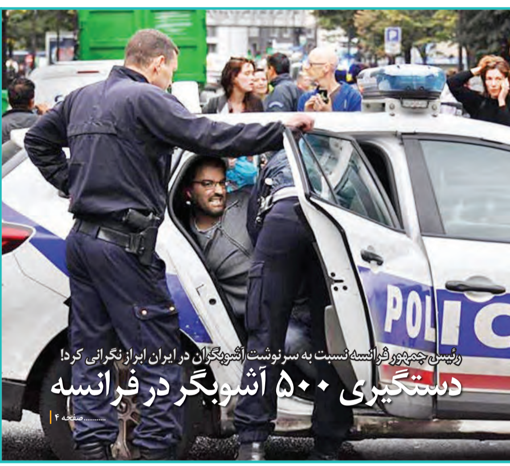
رئیس جمهور فرانسه نسبت به سر نوشت آشنویگران در ایران ابراز نگرانی کرد! دستگیری ۵۰۰ آشوبگر در فرانسه