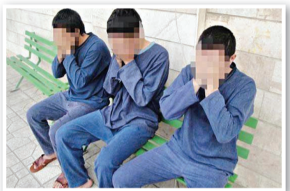
عکس ترشایی است

بجنورد- خبرنگار قدس: فرمانده انتظامی خراسان شمالی از شناسایی و دستگیری قاتلان فراری در شهرستان مانه و سملقان، خبر داد. سردار علیرضا مظاهری گفت: در پی وقوع یک قفسه قتل در یکی از محلات شهرستان مانه و سملقان، بلافاصله مأموران انتظامی وارد عمل شدند و دو نفر از همدستان قاتلان را دستگیر و تحقیقات خود را آغاز کردند. فرمانده انتظامی استان با اعلام این مطلب که متهمان اصلی نژ محل متواری شدند، بیان کرد: با اعترافات متهمان دستگیر شده قاتلان اصلی این جوان ۲۴ ساله در همان لحظات اولیه شناسایی شدند و مأموران در صدد دستگیری آن‌ها برآمدند. وی افزود: مأموران انتظامی با انجام اقدام‌های اطلاعاتی و تخصصی، محل اختفای یک نفر از قاتلان را شناسایی و در عملیاتی ضربتی در مخفیگاهش دستگیر کردند.