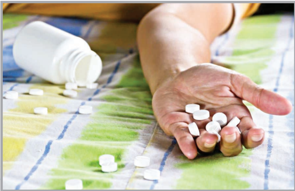
عکس ترشایی است

فاطمه معتمدی: دسترسی آسان به قرص برنج توسط شهروندان برای مقابله با حشرات موذی در حالی صورت می‌گیرد که مسمومیت ناشی از این قرص بسیار خطرناک و تهدیدکننده سلامت افراد است.