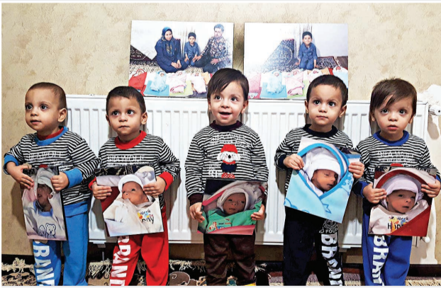
عکس ترشایی است

علی محمدزاده: گویی همین دیروز بود که خبر تولد ۵ قلوهای شاندیزی تیتیر رسانه‌ها شد، اما حدود یک ماه دیگر آن‌ها دو ساله می‌شوند و فقط خدا می‌داند در این مدت والدین آنان چه مشقاتی را تحمل کرده‌اند.