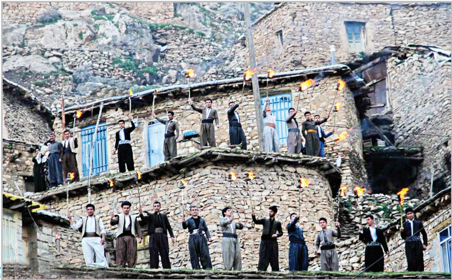
عکس از ایران

قدس عید نوروز در استان کردستان از گذشته همواره با آداب و رسوم خاصی برگزار شده است که بسیاری از آن‌ها تا امروز ادامه دارد. در اساطیر ایران پیدایش نوروز را به بر تخت نشستن جمشید پشندادی نسبت داده‌اند، اما در نزد مردم کرد رای غالب مربوط به داستان «کاوه آهنگر» و «ضحاک» است که کاوه بر ضحاک پیروز شد و مردم به مناسبت این پیروزی بر کوه‌ها آتش افروختند و دست در دست هم به شادمانی پرداختند... صفحه ۳