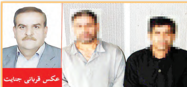
عکس قربانی جنایت